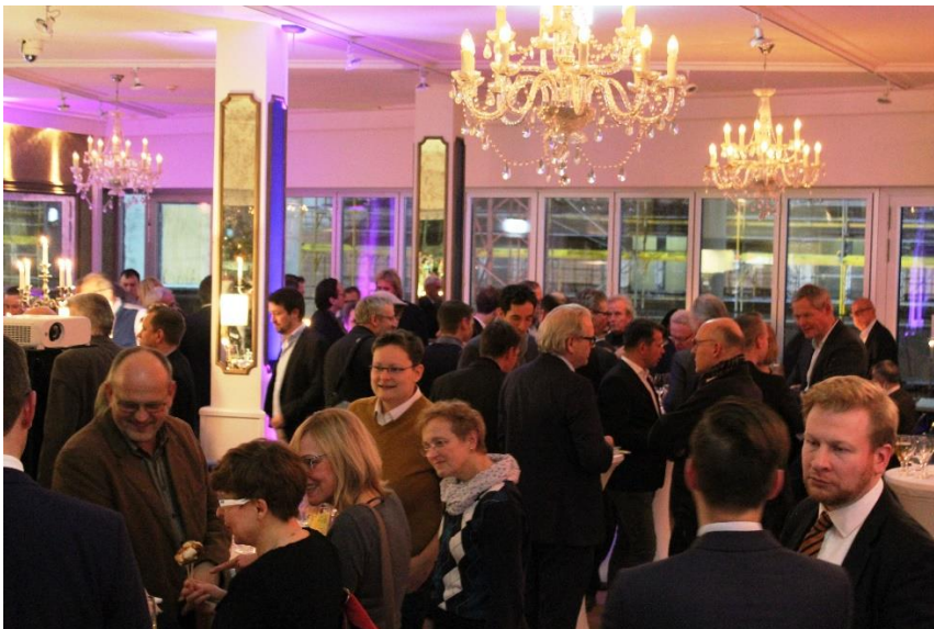
Ausgiebig wurde an diesem Abend „genetztwerk“.